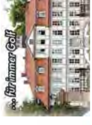
für immer Golf

JÜRGENSTORF, Im Buschbaum: 2 Grundstücke, 814 u. 915 m 2