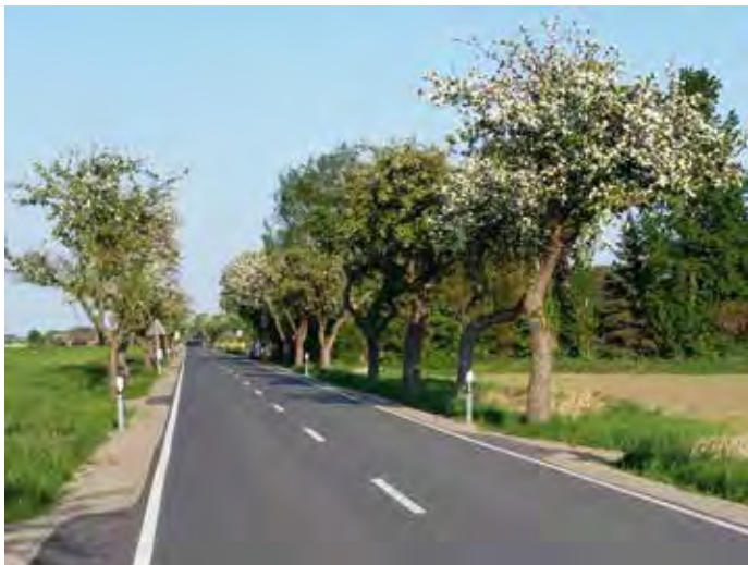
Obstblüte - Obstaltee Brackede

verein sammelt die alten Sorten und vermehrt sie auf jungen Bäumen für die Zukunft. Jede Sorte hat eine Geschichte, hat bestimmte Eigenschaften, die in Rezepten und Gebräuchen Einzog gehalten haben.