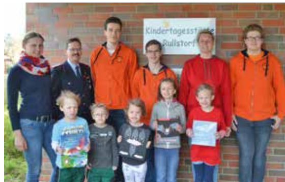
Die Kinder der Kita und der Feuerwehr bauen gemeinsam Fledermauskästen

Die Jugendfeuer vorbereitet das Projekt auf, indem ein Film gedreht, ein Plakat der beteiligten Kinder gefertigt und eine Landkarte der Standorte der aufgehängten Fledermauskästen erstellt wird. Mit dem Projekt wird sich die