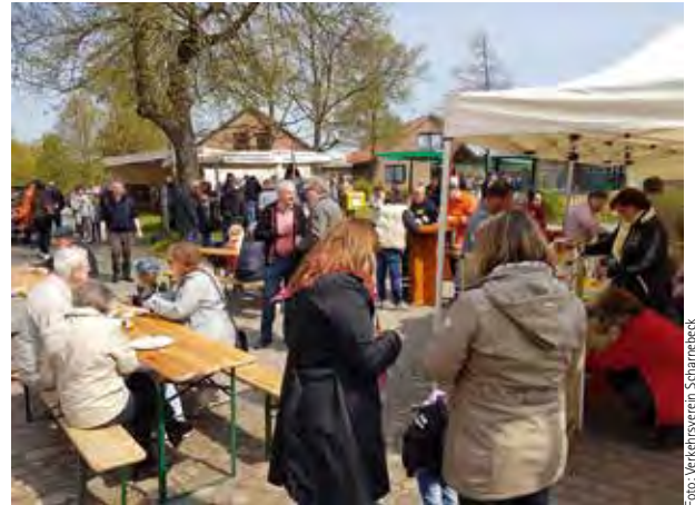
Das Maifest in Hittbergen zog Besucher von nah und fern an