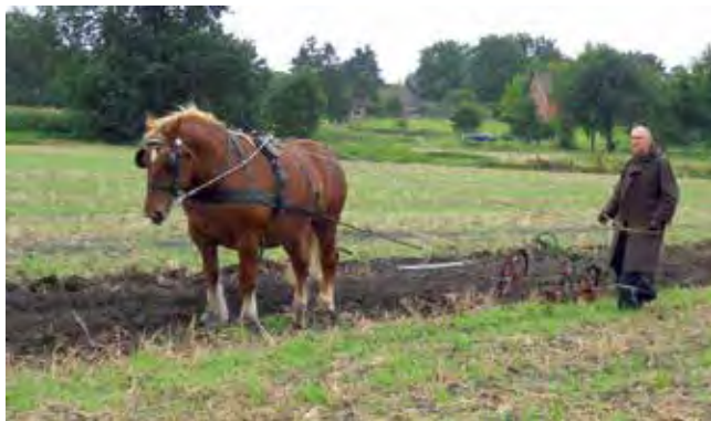
Burschi im Einsatz

Kaltblutpferde sind vom Ursprung her klassische Arbeitstiere, die früher vor den Pflug ge-