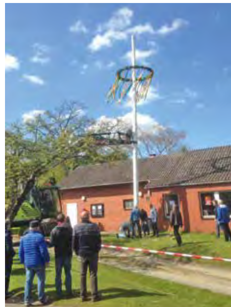
Der Maibaum steht am Feuerwehrhaus

[ Franz Darger ] Der Bürgerverein Rullstorf e.V. lud am 30. April zum 1. Maibaumaufstellen am Dorfgemeinschaftshaus bzw. Feuerwehrhaus ein, um eine neue Tradition zu begründen. Bei strahlendem Sonnenschein fanden sich 120 Bürgerinnen und Bürger am Maibaum ein.