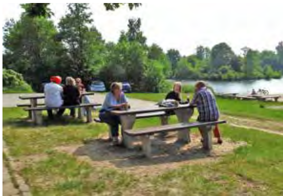
Neue Sitzgruppen und Bänke hat der Verein 2016 aufgebaut

lichen Bänke und Tische, gerade gewonnen bei dem Sparkassen-Wettbewerb „Das tut gut“, wurden nicht nur als Trialhindernisse für Mountainbikes benutzt, sondern auch mit Kohle angeschmolzen. Schmutz und Scherben gehören zum Alltag, aber diese teure Sachbeschädigung wurde zur Anzeige gebracht.