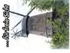
für die Sicht